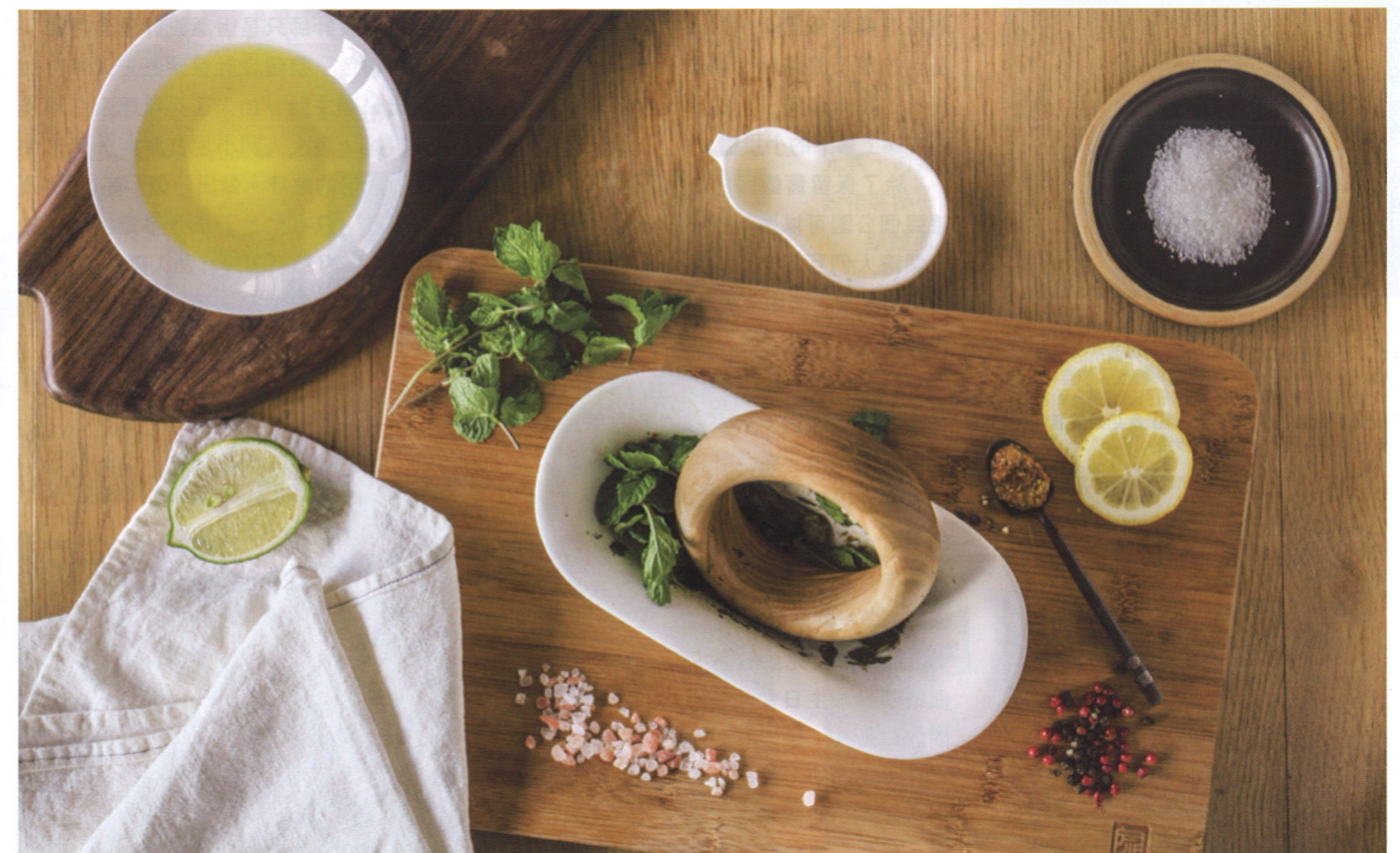
懷著對家常美味醇厚的思念，手持木製碾輪於陶瓷碾槽中來回碾壓，「料理碾」描摹記憶滋味。

思考，將記憶中零碎的片段和滋味拼湊起來，成就了得獎作品「料理碾」，這位家品設計總監尤愛開放式廚房，更認為這是他家必備的元素，「家的生活方式是最重要的。而『家』這個概念因人而異，構築一個好的家，首先必須要了解自己及家人的生活方式，才能依序決定其他元素的重要性。因為有「人」，所以才有「家」，否則只會僅僅是『房子』而已。我熱愛下廚，但又不喜歡因為忙於下廚，而無法與家人和朋友互動，所以開放式廚房就是一種適合我生活方式的空間設計。」■